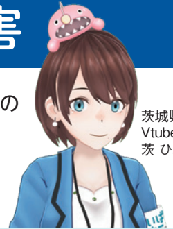
茨城県公認 Vtuber 茨ひより

台風等の影響により大雨が発生すると河川の氾濫や土砂災害が発生しやすく、家屋の流失、土砂への埋没など生命が脅かせるような自然災害が度々発生しています。