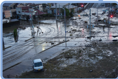
令和元年東日本台風(台風第19号)/太子町