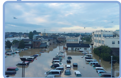
平成27年9月関東・東北豪雨/常総市