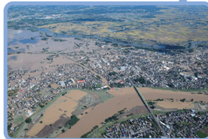
平成27年9月関東・東北豪雨/常総市